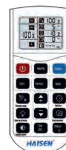
960005 MANDO DE CONTROL REMOTO HD05R COMANDO DE CONTROLE REMOTO HD05R